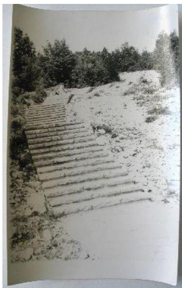
Fotografija 3. „Stepenice do spomenika borcima 1. splitskog partizanskog odreda u Košutama“. Inventarna oznaka MCK-5681.