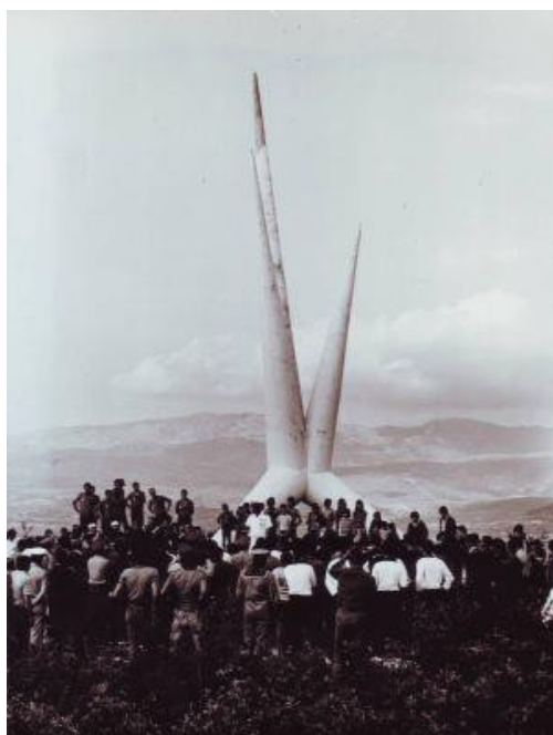
Fotografija 4. „Svečano okupljanje podno spomenika I Splitskom partizanskom odred u Košutama za vrijeme održavanja 31. sportskog prvenstva 1978.g. u Splitu“. Inventarna oznaka MCK-11564-18.