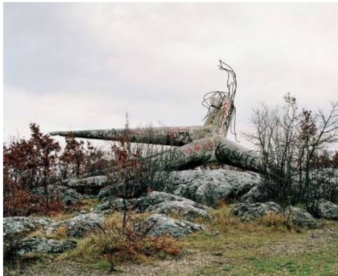
Fotografija 6. Srušeni spomenik u Košutama.

Fotografija 5. „Spomenik na mjestu prve borbe 1. splitskog odreda s okupatorom u Košutama“ Ploča se nalazila ispred zgrade škole u Košutama. Revizijom provedenom 22.3.2010. utvrđeno je da je ploča uklonjena. Reviziju napravila Vedrana Gunjača Gašparac, kustosica Muzeja Cetinske krajine. Inventarna oznaka MCK-9494.