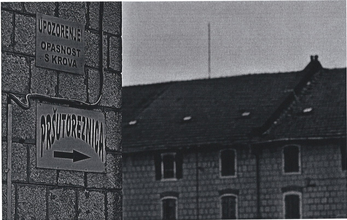
Kompleks kamenih zgrada u centru Sinja građen je u doba Austro-Ugarske, a od tvrtke-kćeri nekadašnjeg 'Agrokora' otkupio ga je poduzetnik iz Hrvaca sa splitskom adresom

Na takav zaključak naveo nas je razgovor s gradonačelnikom Buljem i dokumenti koje nam je poslao. Kada smo, naime, dobili kaznenu prijavu nazvali smo ga i upitali što nam on na tu temu može reći.